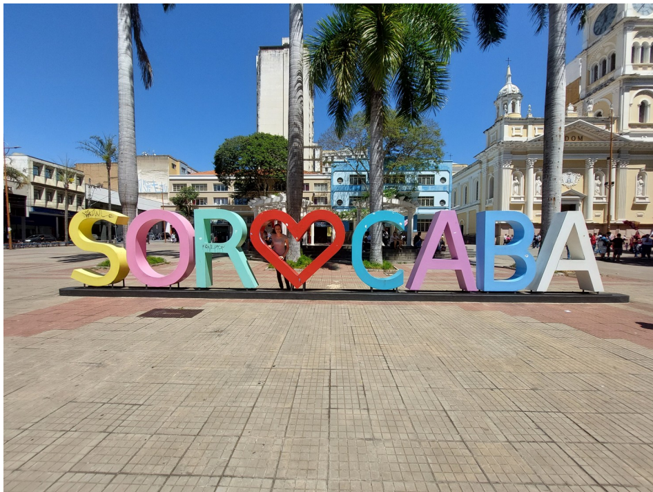
Abbildung 2: Zentraler Platz in Sorocaba

In meiner Freizeit habe ich hauptsächlich Sachen mit meinen Mitbewohnern unternommen. Direkt am ersten Wochenende haben mich meine Mitbewohner zu einer großen Studentenparty einer anderen República mit ca. 500 Leuten mitgenommen. Wir haben auch zwei kleinere Partys in unserer WG veranstaltet. Unter der Woche haben wir abends oft zusammen im Wohnzimmer gesessen, geredet und fern geschaut, oder zusammen gekocht. Am Wochenende habe ich meistens Ausflüge mit meinen Mitbewohnern gemacht. Wir sind zusammen in die Innenstadt gegangen und haben eine Fahrradtour und viele Wanderungen gemacht. Unter anderem haben wir auch einen Tagesausflug nach São Paulo gemacht, wo wir einige Sehenswürdigkeiten, Museen und Parks anschauten.